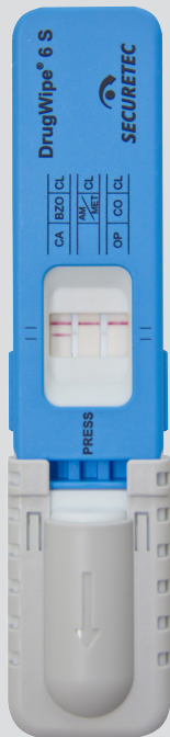
DrugWipe® 6 S Benzodiazepine