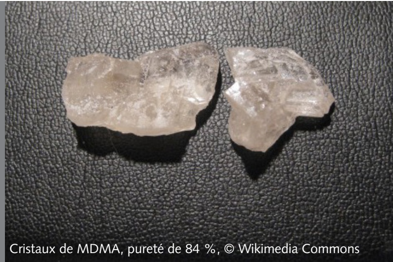
Cristaux de MDMA, pureté de 84 %